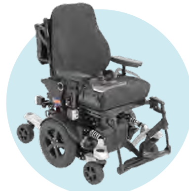
Abbildung zeigt Aufpreispositionen