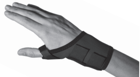
4085 サムフォーム ロング