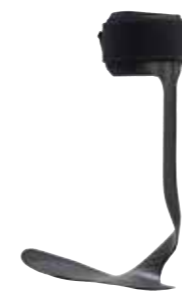
WalkOn Lateral 28U33