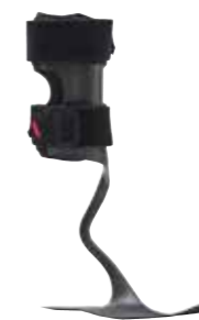
WalkOn Reaction 28U24