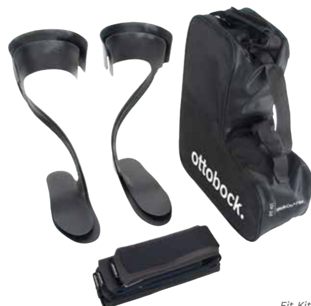
Fit Kit 28T2

Um die bestmögliche Versorgung Ihrer Patienten sicherzustellen, stehen für alle WalkOn Orthesen sogenannte Fit Kits zur Verfügung. Mit diesen Testorthesen soll beurteilt werden, welche WalkOn Orthese im Hinblick auf Grösse und anwendbare Indikation für den Patienten geeignet ist.