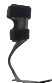
WalkOn Reaction Lateral 28U34