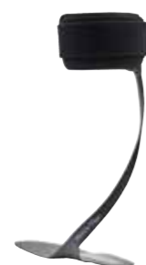
WalkOn Flex 28U22