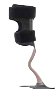
WalkOn Reaction Plus 28U25