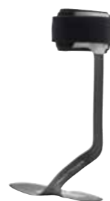
WalkOn Trimable 28U23