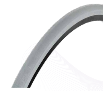
Bandages 1 3/8"