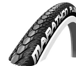
Schwalbe Marathon Plus Evo 1