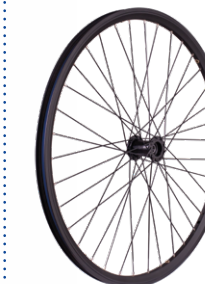
Creuses anti déjantage