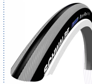
Schwalbe Right Run 1