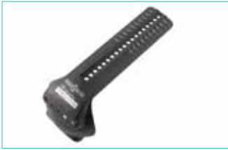
内側サイドレール 5E1=S S/SC用 5E1=M M/MC用 5E1=L L用