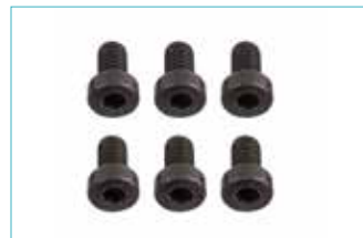
コネクションアダプター ネジセット 5E18=1