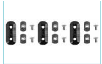
クランピング部品セット 5E8=1