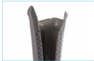
内側ソケットシェル 5E15=*-S S用 5E15=*-M SC/M用 5E15=*-L MC/L用