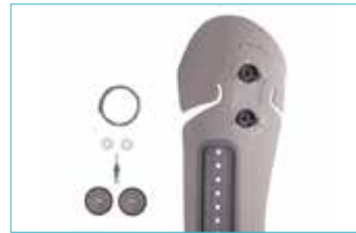
外側ソケットシェル 5E16=*-S S用 5E16=*-M SC/M用 5E16=*-L MC/L用