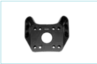
コネクションアダプター 5E6=1