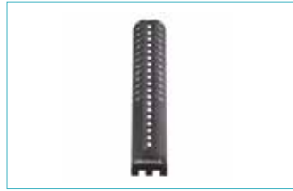
外側サイドレール 5E2=1 直線状 5E3=1 カーブ状