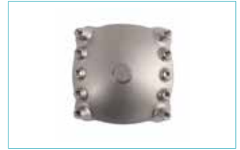
マグネティックボトムシェル 5E5=M S/SC/M/MC用 5E5=L L用