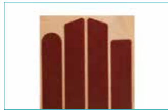
布製粘着テープセット 5E7=M S/SC/M用 5E7=L MC/L用