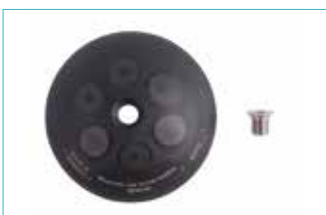
マグネティックキャップ溝付 5E10=M S/SC/M/MC用