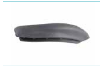
ソケットプリムパッド 5E17=*-S S用 5E17=*-M SC/M用 5E17=*-L MC/L用