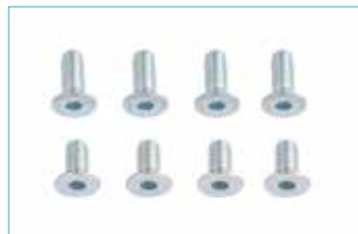
ソケットアダプター ネジセット 5E14=1