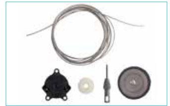
ボア装着システムセット 5E11=1