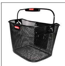
Korb 10 l oder 16 l