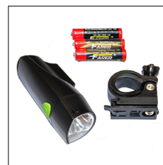
LED Vorderlicht, weiss