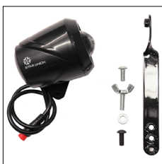
LED Vorderlicht, weiss, integriert