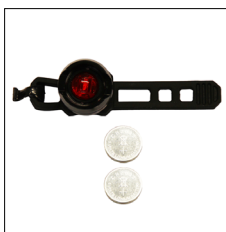
LED Rücklicht, rot