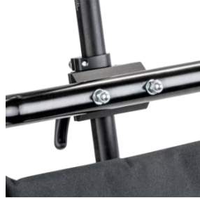
Adapter do montażu zagłówka