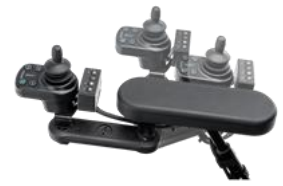
Uchylnie mocowanie panelu sterowania