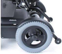
Błotniki dla kół napędowych