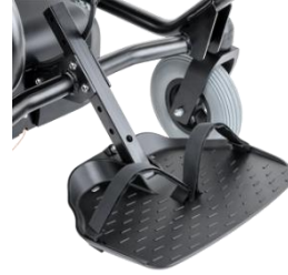
Pas do przypięcia stóp