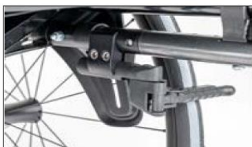
MH05 Outfront-scissor wheel lock