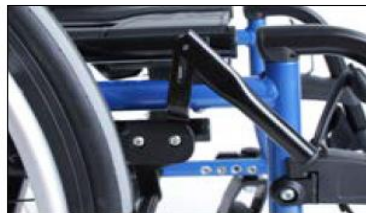
MH10 Knee lever wheel lock extension