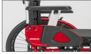
ME17 Side panel with arm support long, height-adjustable