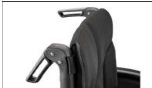
MD56 Push handles foldable