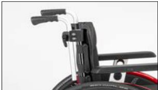
MD55 Push handles height-adjustable, removable