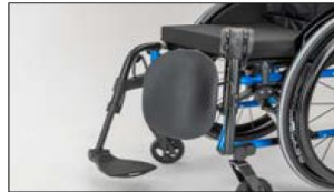
MB22 Amputation leg support, left