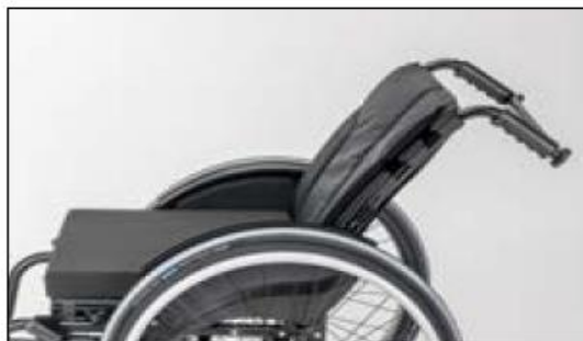
MD10 Back support, angle-adjustable