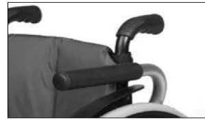
ME50 Side panel, padded