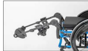
MB25 Leg supports, elevating

Firma Otto Bock Polska zastrzega sobie możliwość dokonywania zmian w konfiguracji zamówienia w pełnym porozumieniu z zamawiającym na wypadek niemożności dostarczenia pierwotnej wersji konfiguracji.