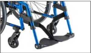
MB10 Leg support, individual, angle-adjustable, swivel up