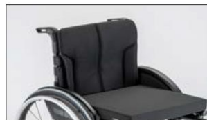
MD05 Back support upholstery, breathable