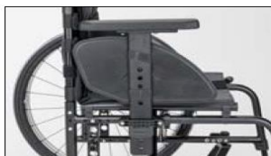
ME11 Plug-on side panel plastic