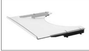
ME60 Therapy tray