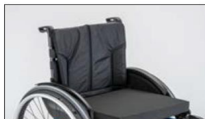
MD03 Back support upholstery, padded