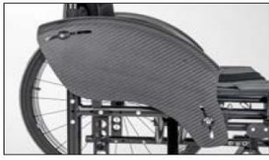
ME04 Carbon side panel