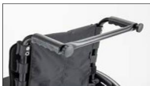
MD58 Stabiliser bar