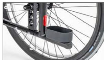
MA57 Crutch holder