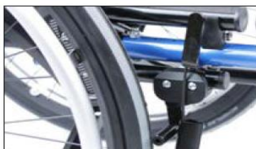
MH01 Knee lever wheel lock