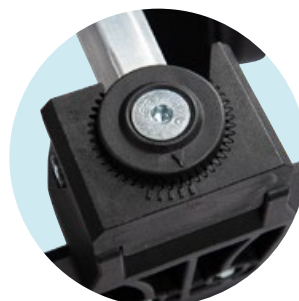
Winkelverstellung der Fußplatte