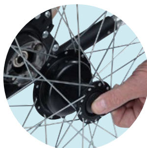
Schnellspannachse bei 24"-Antriebsrädern