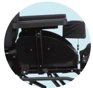
Seitenteil abnehmbar mit Armauflage (einstellbar)