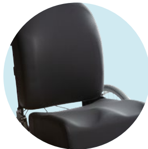
Konturiertes Rücken- und Sitzkissen