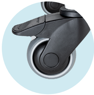
Laufrolle mit Feststeller