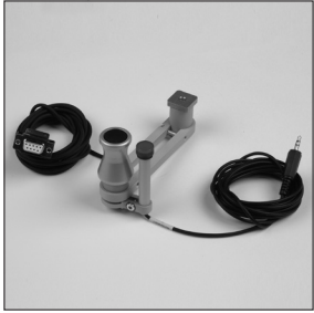
EU 40 Mini-joystick