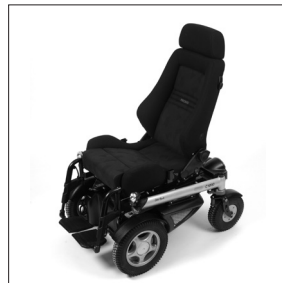
EC 40 Recaro N-joy