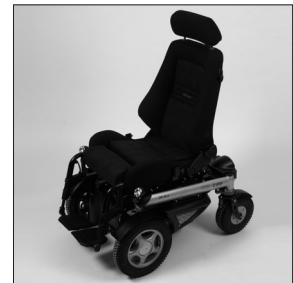
EC 42 Dossier LX