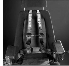
EP 51 Harnais