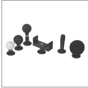
EU 23 – EU 28 Options manipulateur