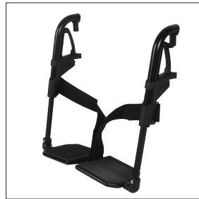
EB 02 Repose-pieds à palettes séparées