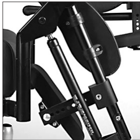
EB 20 Repose-jambes à vérin pneumatiques