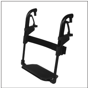
EB 03 Repose-pieds à palette monobloc