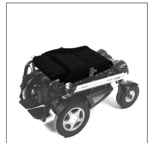
EC 46 Assise W