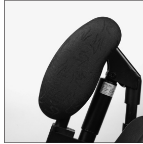
EB 80 Rembourrage repose-jambes