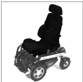
EC 43 Dossier LT