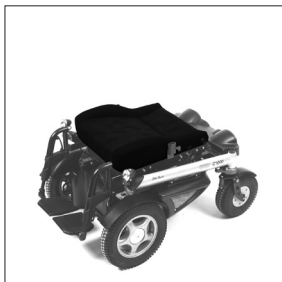
EC 44 Assise F