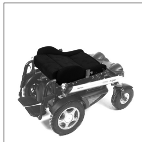
EC 45 Assise X