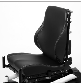
EC 24 Unité d'assise Contour avec contours profonds EC 26 Revêtement cuir synthétique