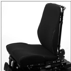
EC 23 Unité d'assise Contour avec contours plats EC 25 Revêtement standard