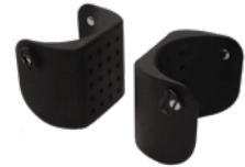
外転パッド 1 組