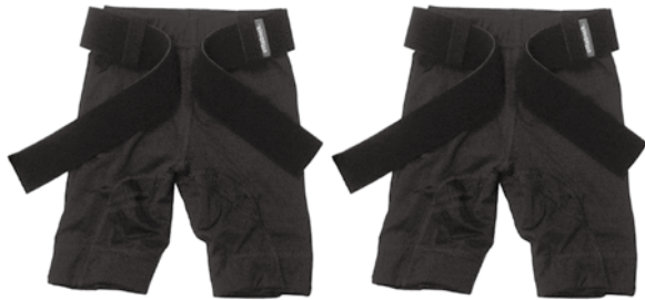
パンツ本体 2 枚