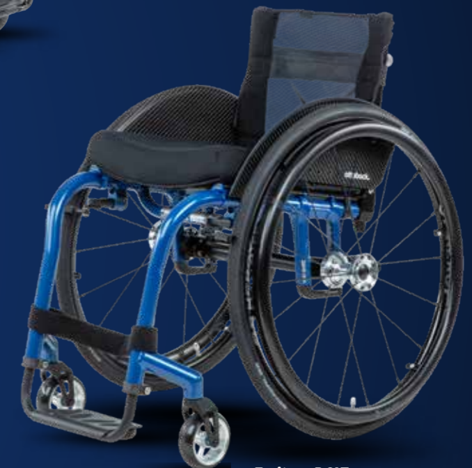
Zenit onn R CLT Art.-Nr. 480F168=1_AA05_C