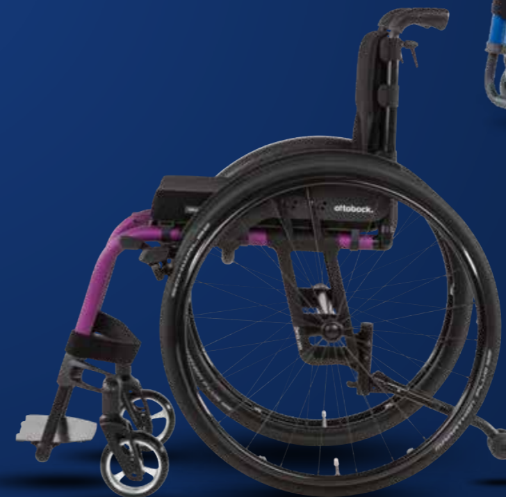
Zenit onn R Art.-Nr. 480F168=1_AA04_C