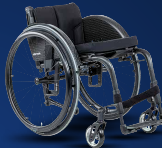
Zenit onn F Art.-Nr. 480F168=1_AA02_C