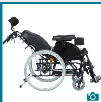
Ajustement de l'inclinaison de dossier