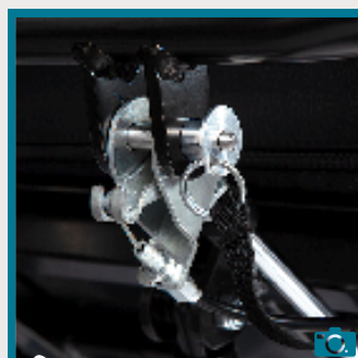
Blocage de sécurité du dossier par goupille