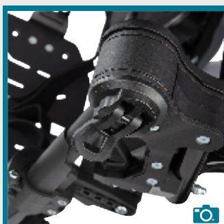
Support relève-jambes ajustables