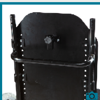
Plaque de dossier, réglable