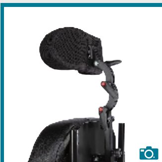
Appui-tête réglable sur 10cm