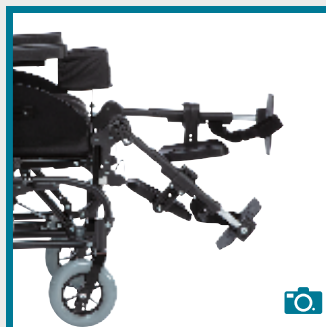
Relève-jambes à compensation