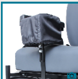
Plot d'abduction amovible