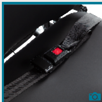
Ceinture de sécurité