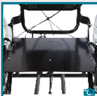
Plaque d'assise réglable