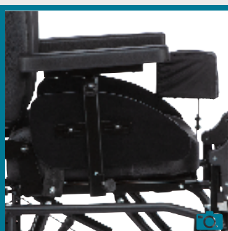
Protège-vêtements amovibles, réglables avec accoudoirs réglables