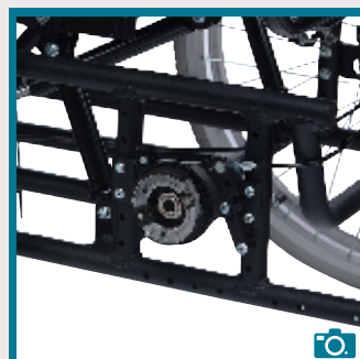
Adaptateur roues arrière 24"