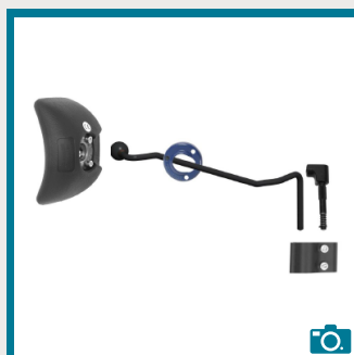
Support thoracique latéral