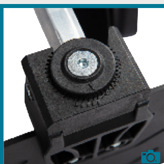
Palettes repose-pieds réglables en angle