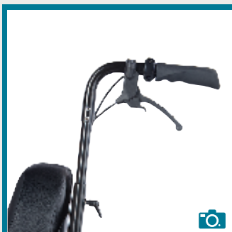
Poignées de poussée, télescopiques