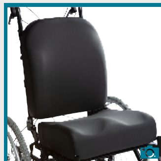
Assise et dossier contour