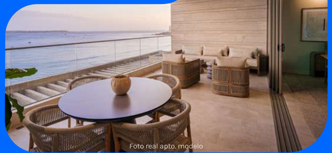
Foto real apto. modelo