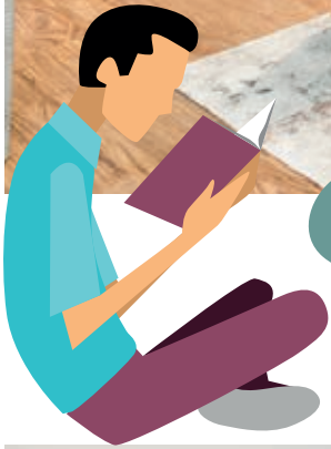
Zonas comunes de lectura, estudio o trabajo.