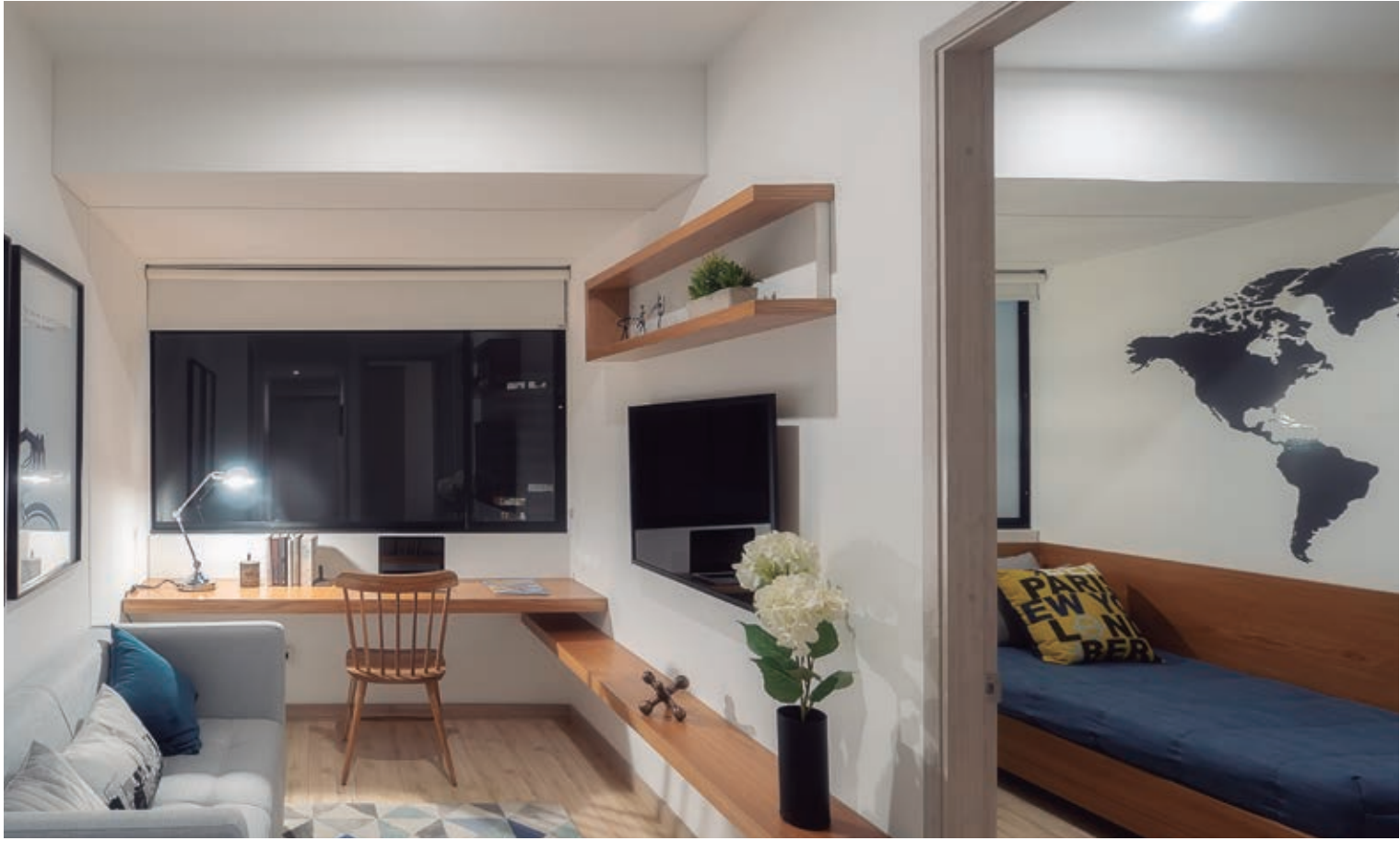
Imágenes reales, apartamento tipo D