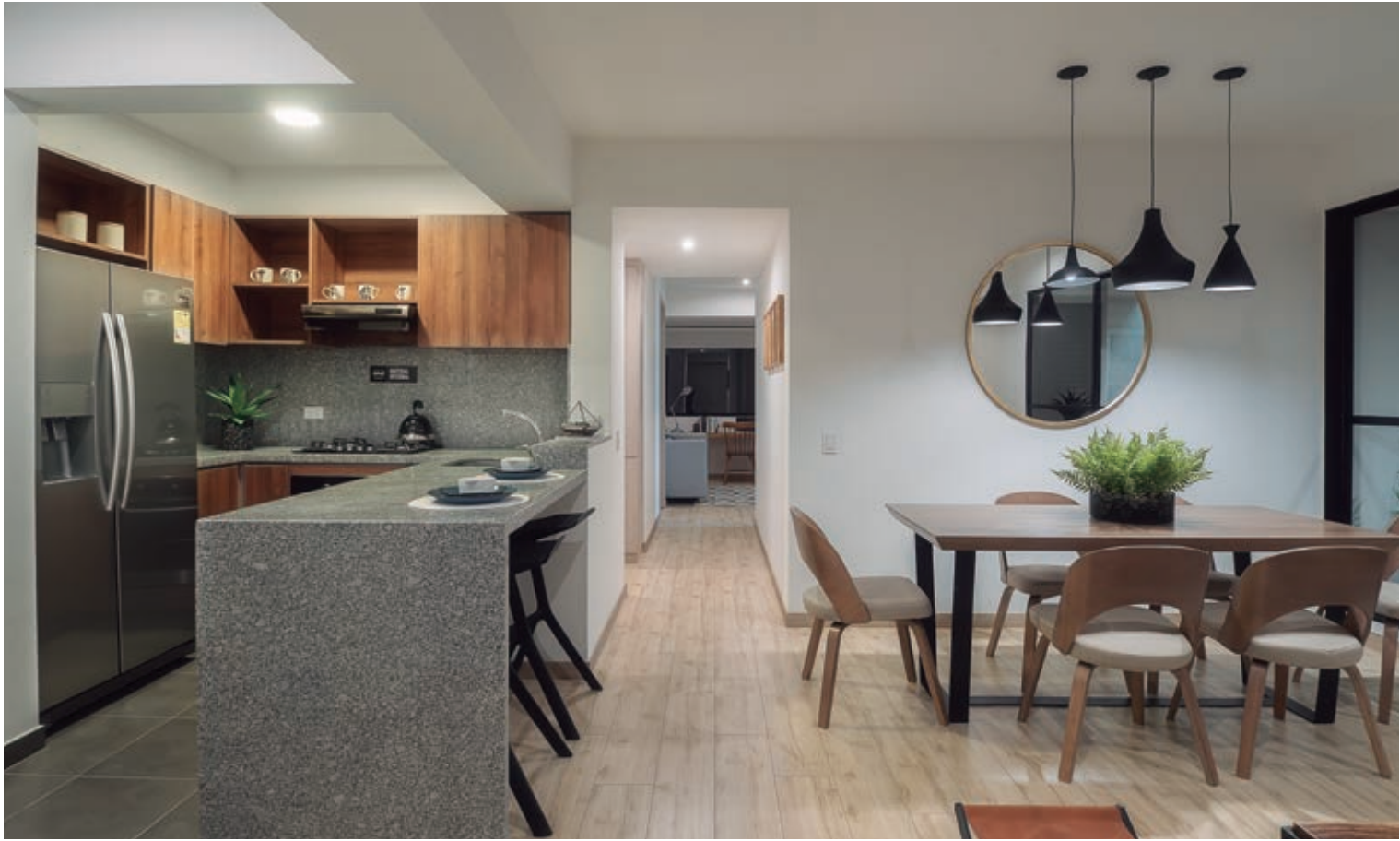
Imágenes reales, apartamento tipo D