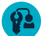
El o los inmuebles, El o los Proyectos

Es la persona que se ha vinculado como cliente en alguno de los proyectos comercializados por Arquitectura y Concreto habiendo sido previamente remitido al proyecto por parte de un corredor inmobiliario o de cualquier otro tercero referente.