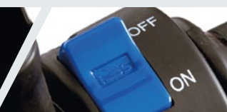
TECNOLOGÍA i3S PARA AHORRO DE COMBUSTIBLE