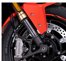
Frenos de disco Brembo