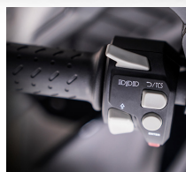
2 Modos de conducción, y control de tracción.