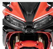
Luces LED completas