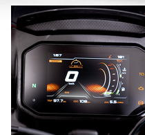
Panel digital TFT de 7 pulgadas con bluetooth

Llantas de aleación con neumáticos Pirelli DIABLO ROSSO III