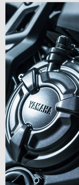
MOTOR BI-CILÍNDRICO CP2