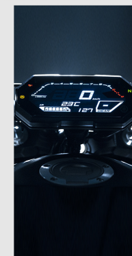
TABLERO MULTIFUNCIONAL DE LCD