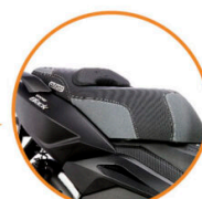
BAÚL CON CAPACIDAD PARA UN CASCO