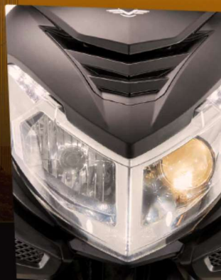
LUZ FRONTAL ASIMÉTRICA CON LUZ DÍA LED