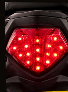
STOP CON LUCES LED