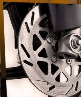
FRENO DE DISCO DELANTERO