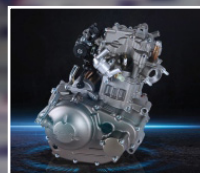
Motor de Alta Compresión