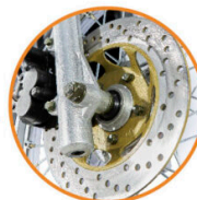
FRENO DE DISCO DELANTERO MAYOR SEGURIDAD