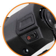
ARRANQUE ELÉCTRICO Y PEDAL