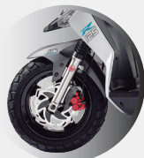
FRENO DE DISCO DELANTERO