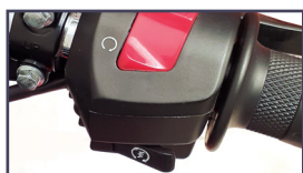
PARTIDA ELÉCTRICA Y PEDAL