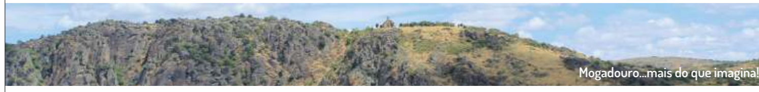
Mogadouro...mais do que imagina!