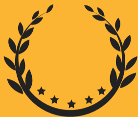
Image de marque valorisée

Permettre l'accès à son site de recrutement pour des futurs profils ou l'accès aux outils internes à ses collaborateurs est un principe de non-discrimination.