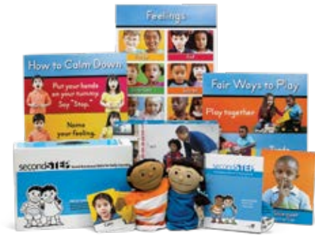
Programa Second Step

Ayude a los niños de preescolar y prekínder a emplear su energía y su potencial enseñándolos a escuchar, prestar atención, controlar su comportamiento y llevarse bien con los demás. Cuando los estudiantes conocen la autorregulación y las habilidades socioemocionales que se enseñan en el programa Second Step basado en investigaciones en el momento de entrar en el kínder, están preparados para el éxito.