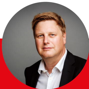
德國 iF Design 執行長 Uwe Cremering

我們將 iF 設計獎定位為全球最具影響力的設計平台——在這裏，無論是知名品牌、新創公司、還是設計師與創意人才，都能備受啟發，並在競爭中脫穎而出。