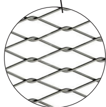
Maille acier inoxydable