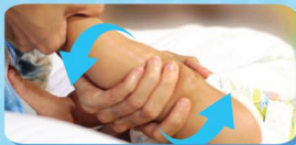
V. PIJATAN KAKI