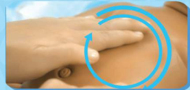
III. PIJATAN PERUT