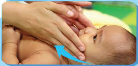
I. PIJATAN WAJAH