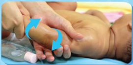
IV. PIJATAN TANGAN