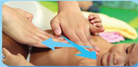
II. PIJATAN DADA