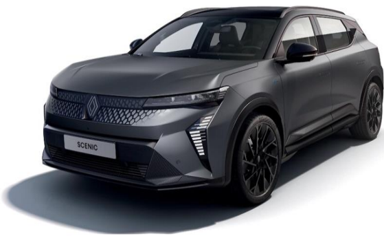
Grå Schiste Mat