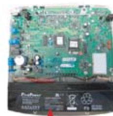
Batterie de secours