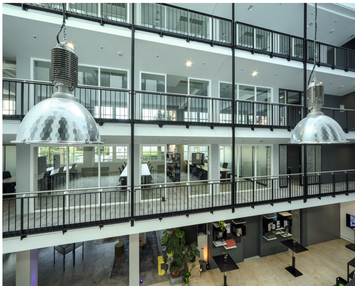
American Style durch balkonartige Flure