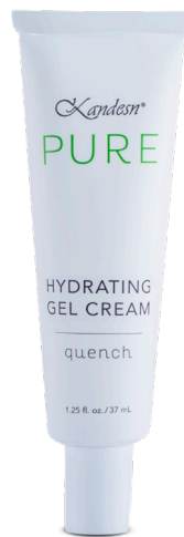
37 mL #01705