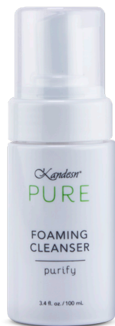
100 mL #01533