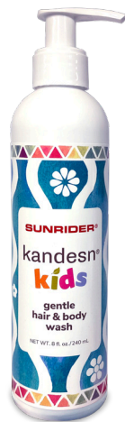
8液态盎司 / 240毫升 #01540