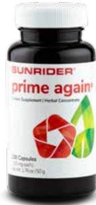
# 2023118 100 כמוסות

ת: לפי הרפואה הסינית, בריאות משמעה איזון בין חמישה יסודות: עץ, אש, אדמה, מתכת ומים. לכל יסוד יש תכונות משלו המשפיעות על הגוף. יסוד האש קשור למעי הדק וללשון, והמאפיינים שלו הם שמחה, פעולה ומוטיבציה.