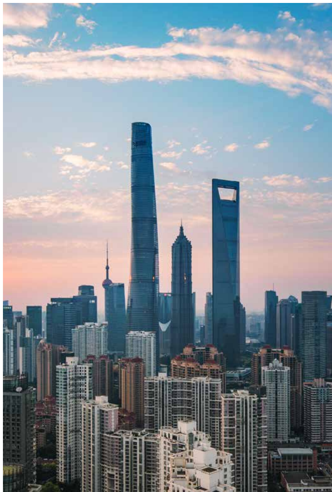
02 凭借632米的高度位列中国第一、世界第三高楼，多玛凯拔安防及门控解决方案助力其获得“LEED绿色能源与环境设计先锋奖-金奖”认证。