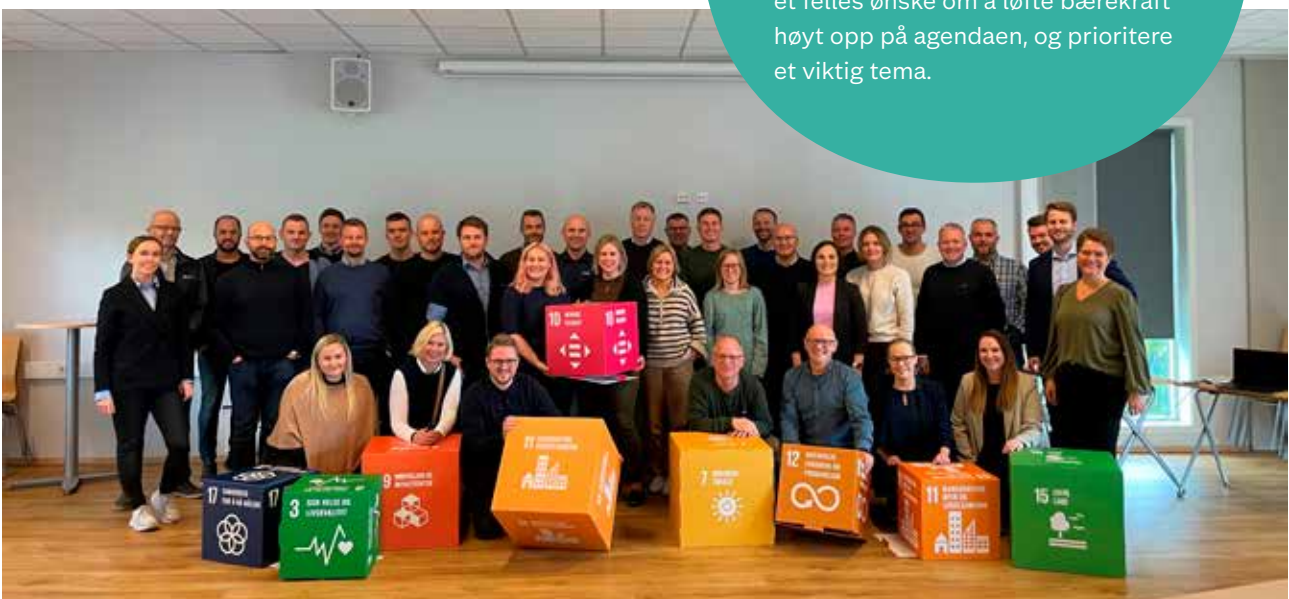
Bilde fra første samling i nettverket. Coop Nord deltar med tre ansatte fra butikkdrift, eiendomsavd. og medlems- og markedsavd.

Coop Nord er en del av bærekraftsnettverket «The Walk». TUIL Fotball og BDO har satt sammen et program med fire hovedsamlinger over ett år, der 18 ulike bedrifter deltar med et felles ønske om å løfte bærekraft høyt opp på agendaen, og prioritere et viktig tema.