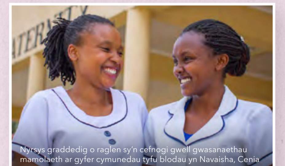
Nyrsys graddedig o raglen sy'n cefnogi gwell gwasanaethau mamolaeth ar gyfer cymunedau tyfu blodau yn Navaisha, Cenia

Gallech bostio eich hoff beth am Fasnach Deg ar gyfryngau cymdeithasol a thagio 5 ffrind i wneud yr un peth!