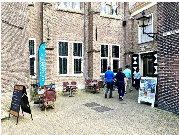
expositie/entr e Prinsenhof Delft

Het museum sloot aan bij Delftse Keramiek Dagen met twee tentoonstellingen en een speciale rondleiding. T/m 8 september 2024 was hier de tentoonstelling 'Pioniers in Keramiek' te zien, een dialoog tussen historisch en hedendaags keramiek. En t/m 30 juni was er ook 'Keramiekprijs De Kei 2023', een tentoonstelling bij de tweejaarlijkse keramiekprijs uit Delft, ook georganiseerd door de SKPD. Rond het weekend van de keramiekmarkt zijn er speciale, op keramiek toegespitste, rondleidingen gegeven. Bovendien had het museum ook op de markt een kraam ingericht om het publiek te verwijzen.