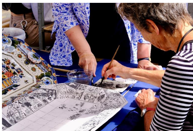
beschilderen bord bij Royal Delft

De tentoonstelling 'Delfts blauw: ode aan het ambacht. Maken en vernieuwen' vertelt over het maken van Delfts blauw bij de Porceleyne Fles of Royal Delft en hoe dit in relatie staat tot de makers van vandaag. Op de markt heeft Royal Delft een kraam ingericht waar het publiek kan mee schilderen aan een uniek bord, 'made in Delft!'.