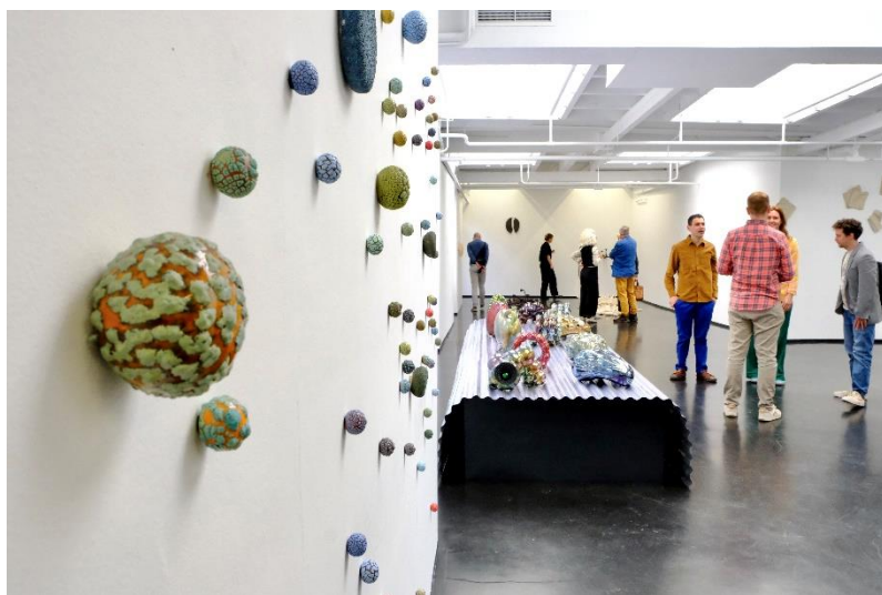
impressie expositie Expositieruimte 38CC