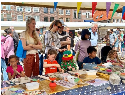
DKD 2024 kinderleikraam

Op de markt was een kinderleikraam waar kinderen onder professionele leiding het materiaal klei konden leren kennen. We vonden het als organisatie belangrijk om op deze manier te investeren in de toekomst. De kramen van Atelier de Brugspin en Stichting Philadelphia vertegenwoordigde de keramiekresultaten van cliënten met een lichte tot matige verstandelijke beperking. Andere participerende instellingen waren ook op de markt vertegenwoordigd middels een kraam, Royal Delft en Museum Prinsenhof.