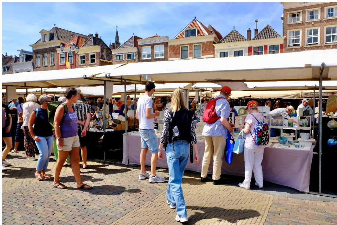
impressie keramiekmarkt DKD 2024

De Delftse horeca was hierbij onontbeerlijk als participerende partij. De dagelijkse versnaperingen, maar ook het verblijf van keramisten en meerdaagse bezoekers, hebben de plaatselijke ondernemers goed gedaan. En de promotie van het mooie Delft is zeker weer gelukt, van uit een hedendaagse kunstblik.