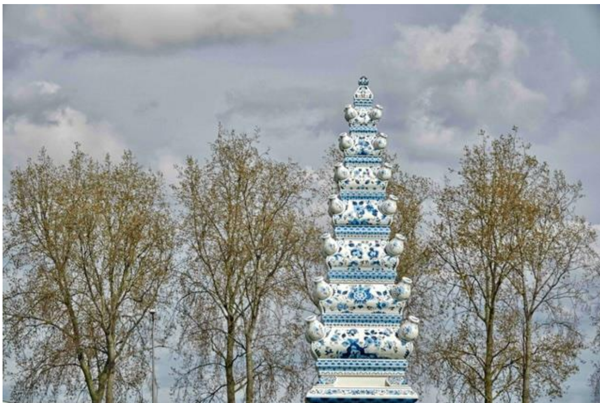
De winnende foto 2024 door Gerard Stolk

Het doel van Delftse Keramiek Dagen is om via kunst, keramiek in dit geval, mensen samen te brengen en Delft te promoten en kunst te manifesteren. Kunst kan reacties losmaken en oproepen, waardoor dialoog en debat plaatsvinden. Het onderwerp keramiek, is voortgekomen uit het feit dat Delft wereldwijd bekend is als keramiekstad, door de geschiedenis van het Delfts blauw.