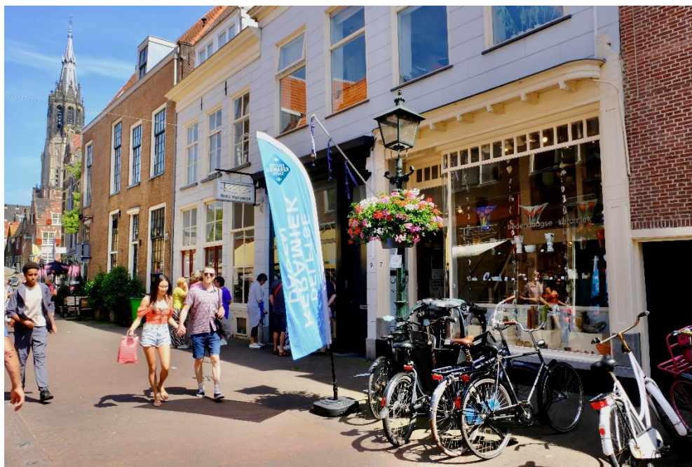
deelnemer Galerie Terra Delft Nieuwstraat