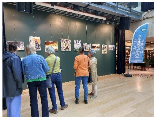
fototentoonstelling in DOK-OPEN