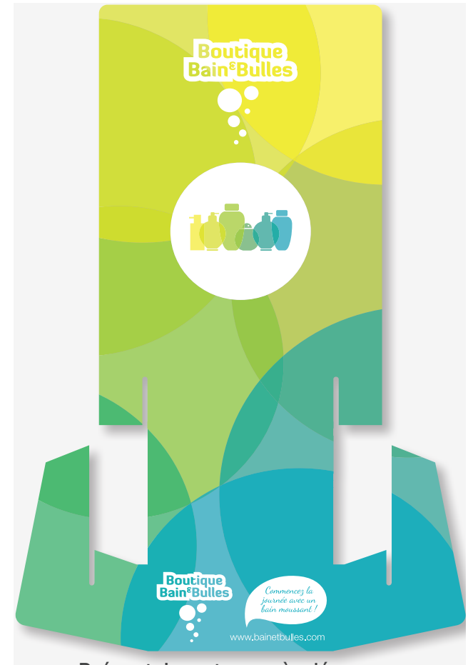
Présentoir carton après découpe