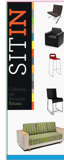
Archivo en la plantilla