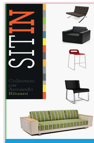
Archivo en la plantilla