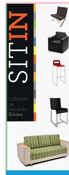
Archivo en la plantilla