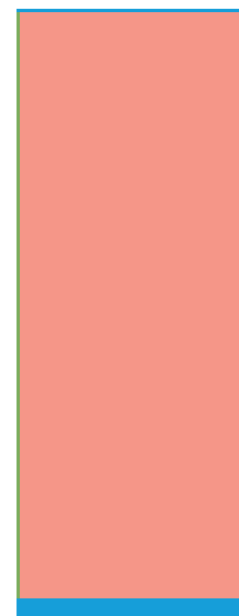
84 x 204 cm