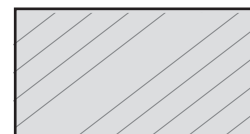
4 cantos rectos 9,9 x 21 cm