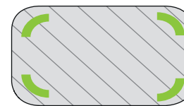
De 1 a 4 cantos romos 9,9 x 21 cm