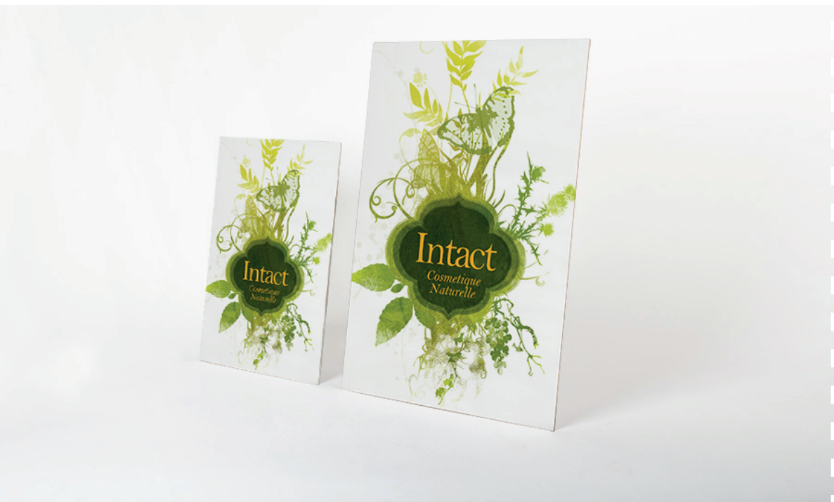
PLV 21x30 cm

- 1 Fichier PDF pour la quadri à 300 dpi