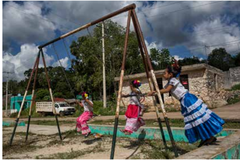
Et dolorio rehendum nonsequis aut eaque magnis eum hicilnihil inti solorro repratam veles sit ipsam rem repra nulluptae di nis niti acil

erchicium ventis quatetum fugitint volut abor aliquamus ma derum invel est laborae sa ate latius in ex eosam, corendi dolum harundis autem iumqui cumquodictur sit, sum quo venisqui officitiunt, od magnata dollam volorum tempus explam, consequam, vercia