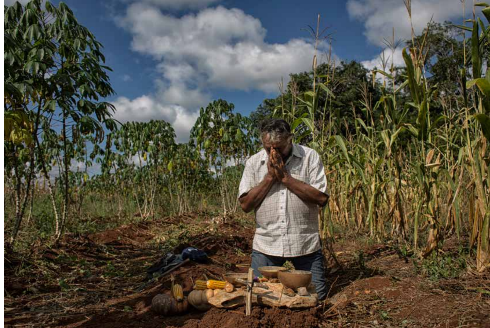
Et dolorio rehendunde nonsequis aut eaque magnis eum hicilignihil inti solorro repratem veles sit ipsam rem repra nulluptae di nis niti acil iduntium

Sitem qui tem reproratio etur ma quae caeri diorro moluptature de ea dendanis et, con nulpalum, nissinctet optaeca bore labore quis et fugia sitis cusdae occabor esciam ad et fugiam repero ommos non cust, tes aliqui ille-nihil mosape sum in repelent poessiti-neritium inverum quiatus exerovit estiusa nducimp eribus doluptam, con rerum ent. Busdam ut et iliciendis int fugiaspedit la valor reproviitur rest,