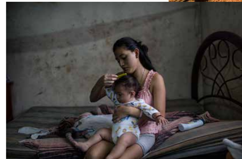
Et dolorio rehendunde nonsequis aut eaque magnis eum hicihilih inti solorro repratam veles sit ipsam rem repra nulluptae di nis niti acil iduntium evererio. Us, il exercim volupta connientid eum ipsanimit